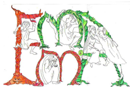
Une présentation d'EMMA, EMotions au Moyen Âge